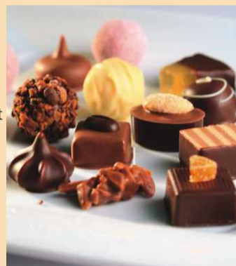
Für individuelle Präsente bieten wir Ihnen beispielsweise auch die Kombination von Lahrer Pralinen und Lahrer Wein. Sprechen Sie uns an.

Zur Erleichterung bei der Auswahl haben wir für Sie beispielhaft drei Weinpräsente zusammengestellt – das CLASSIC-Geschenk mit drei Gutsweinen, das PRESTIGE-Präsent mit Guts- und Lagenweinen und das EXCLUSIV-Präsent in der Holzcassette mit Großen Gewächsen. Selbstverständlich lassen sich die Weine und die Flaschenzahl je Geschenkkarton frei variieren. Für individuelle Präsente bieten wir Ihnen auch Kombinationen mit anderen Produkten an, beispielsweise mit Lahrer Pralinen.